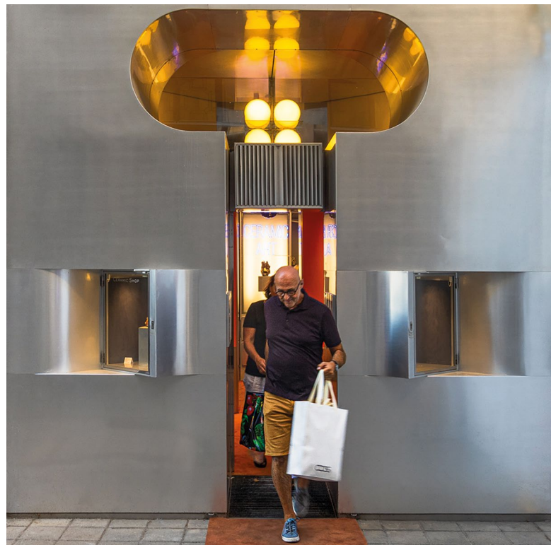
↑ fig.02. — Chatting I (2025). Fundación Santa Fé – Ambulatorio, Bogotá (Colombia). Equipo Mazzanti.